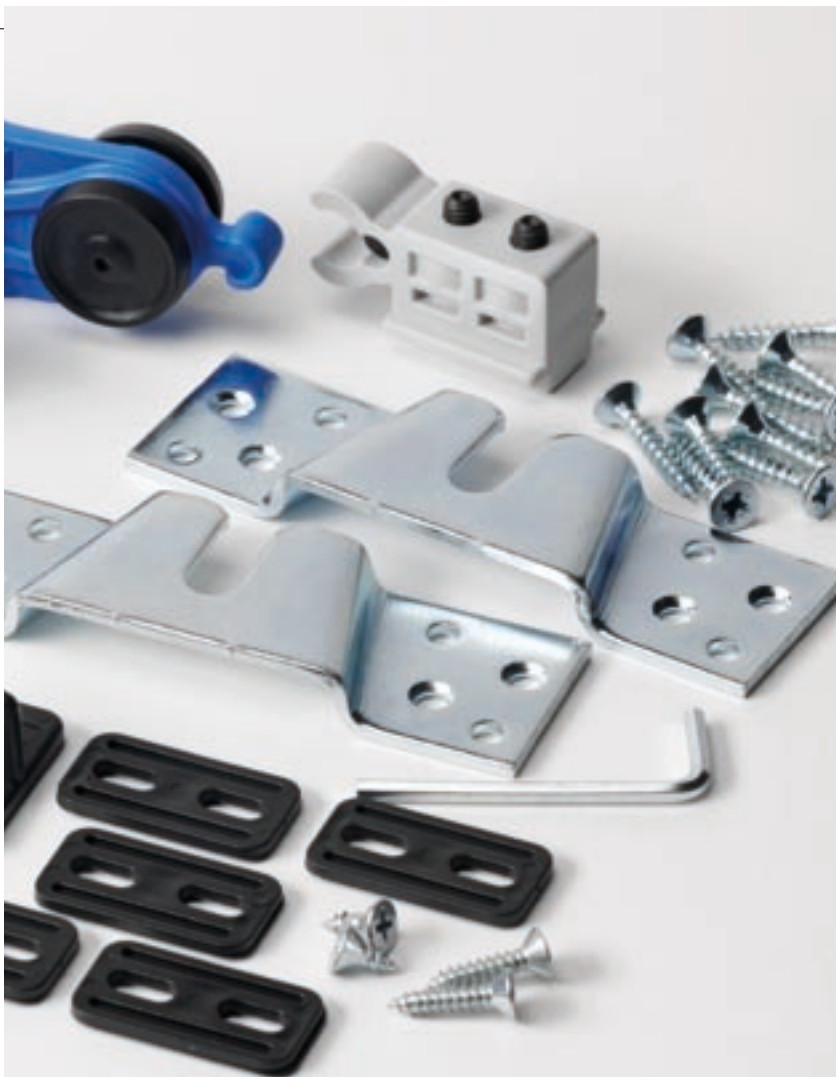
Guida e carrello a 4 Ruote

Collaudata da anni di esperienza, la guida Alfa Lum, oltre alla straordinaria scorrevolezza e assoluta silenziosità, offre una seria e fondamentale garanzia testata da prove tecniche di laboratorio e dalla soddisfazione dei clienti.