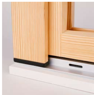
Vista da esterno

Fra battente e pavimento, la misura di 8,5 mm permette la posa successiva di parquet o moquette, oppure di compensare eventuali imperfezioni del pavimento stesso.