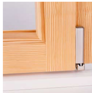
Vista da interno.